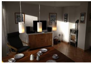
Wohnzimmer mit Kamin