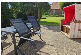
Grosser Garten mit Strandkorb

Wir begrüßen Sie in "Innas Hus" in Wyk auf Föhr, einem alten Kapitänshaus aus dem Jahr 1910. Das Haus wurde bis Mitte 2023 umfangreich renoviert. Es wurde Wert darauf gelegt, die alte Bausubstanz zu erhalten und mit neuen, modernen Elementen zu verbinden. Die Ferienwohnung im Erdgeschoss bietet auf ca. 105 m 2 Wohnfläche Platz für 4 (-5) Feriengäste. 2 Schlafzimmer, ein Wohnzimmer, ein offener Küchen-Ess-Bereich sowie ein großes und ein kleines Badezimmer sind Bestandteil der Ferienwohnung. Zudem stehen ein Gartenanteil mit großer Terrasse und Stellplatz für 1(-2) PKW zur Verfügung. Innas Hus zeichnet sich durch seine zentrale Lage im Herzen von Wyk aus. Die Ortsmitte mit der Fußgängerzone, Einkaufsmöglichkeiten und der Strand sind in wenigen Minuten zu Fuß oder mit dem Fahrrad zu erreichen.