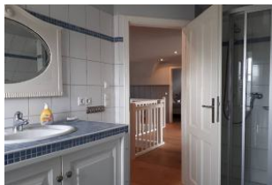
Badezimmer mit Dusche und Badewanne