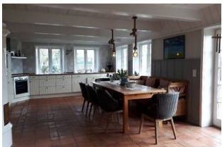
grosse helle Küche

Unser Haus befindet sich in Oldsum, ein ruhiges, z.T. landwirtschaftlich geprägtes Künstlerdorf mit vielen traditionellen Friesenhäusern. Traditionelle Friesenbauart, Reetdach, Holzdecke, Holzsprossenfenster, Kachelofen. Cottofliesen im Erdgeschoss, heller Eichenboden im ersten Stock. Große lichtdurchflutete Galerie im Eingangsbereich. 800 qm Grundstück mit einem freien Blick auf eine Pferdekoppel. Im Ort befinden sich zwei Cafés, ein Gasthaus, zwei Bauernläden, ein Sparmarkt mit frischen Brötchen, Fahrradverleih, Bastelläden. Das Haus ist 160 qm groß und bietet komfortablen Raum für 7 Personen (4 Erwachsene und 3 Kinder). Neben dem großzügigen, offenen Wohnzimmer und einer mit modernster Technik ausgestatteten, großen Wohnküche, gibt es vier Schlafzimmer, zwei mit Doppelbetten, eines mit zwei Einzelbetten, zusätzlich ein Einzelzimmer. Ein Bad mit Dusche, WC und Badewanne, eines mit Dusche und WC, zusätzlich ein WC.