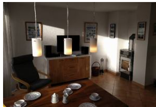
Wohnzimmer mit Kamin