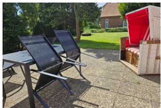
Grosser Garten mit Strandkorb

Wir begrüßen Sie in "Innas Hus" in Wyk auf Föhr, einem alten Kapitänshaus aus dem Jahr 1910. Das Haus wurde bis Mitte 2023 umfangreich renoviert. Es wurde Wert darauf gelegt, die alte Bausubstanz zu erhalten und mit neuen, modernen Elementen zu verbinden. Die Ferienwohnung im Erdgeschoss bietet auf ca. 105 m 2 Wohnfläche Platz für 4 (-5) Feriengäste. 2 Schlafzimmer, ein Wohnzimmer, ein offener Küchen-Ess-Bereich sowie ein großes und ein kleines Badezimmer sind Bestandteil der Ferienwohnung. Zudem stehen ein Gartenanteil mit großer Terrasse und Stellplatz für 1(-2) PKW zur Verfügung. Innas Hus zeichnet sich durch seine zentrale Lage im Herzen von Wyk aus. Die Ortsmitte mit der Fußgängerzone, Einkaufsmöglichkeiten und der Strand sind in wenigen Minuten zu Fuß oder mit dem Fahrrad zu erreichen.