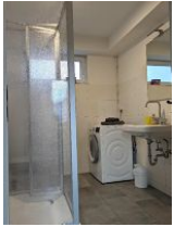
Kleines Bad mit Waschmaschine, Dusche und WC