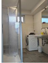
Kleines Bad mit Waschmaschine, Dusche und WC