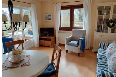
Die Unterkunft befindet sich im EG.

Deelswai 50 ist ein Bungalow am Gotinger Kliff auf einem grossen Grundstück. Der Bungalow ist nur 2 min vom Gotinger Strand entfernt. Ein komfortables Einzelhaus mit Kamin, Wintergarten, grosser Garten und nur ein Katzensprung vom Meer entfernt. Hier haben Sie 1 Schlafzimmer mit Doppelbett, Badezimmer mit Dusche, separate Küche, Wohnbereich mit Kamin und Zugang zum Garten. Der schöne Garten wartet auf Sie, damit sie relaxen können. In diesem Nichtraucherhaus sind keine Haustiere erlaubt. Besondere Merkmale: Abstellmöglichkeit f. Fahrräder, Allergikerfreundlich, Backofen, Bettwäsche/Handtücher*, CD-Player, Endreinigung*, Filterkaffeemaschine, Flachbild-TV, Föhn, Garten, Gartenmöbel, Gefrierfach, Grillmöglichkeit, Kamin, Kinderfreundlich, Nichtraucher, Parkplatz, Radio, Ruhig, Satelliten-TV, Seniorenfreundlich, Terrassenmöbel.