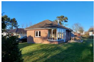
Aussenansicht des Hauses

Deelswai 50 ist ein Bungalow am Gotinger Kliff auf einem grossen Grundstück. Der Bungalow ist nur 2 min vom Gotinger Strand entfernt. Ein komfortables Einzelhaus mit Kamin, Wintergarten, grosser Garten und nur ein Katzensprung vom Meer entfernt. Hier haben Sie 1 Schlafzimmer mit Doppelbett, Badezimmer mit Dusche, separate Küche, Wohnbereich mit Kamin und Zugang zum Garten. Der schöne Garten wartet auf Sie, damit sie relaxen können. In diesem Nichtraucherhaus sind keine Haustiere erlaubt. Besondere Merkmale: Abstellmöglichkeit f. Fahrräder, Allergikerfreundlich, Backofen, Bettwäsche/Handtücher*, CD-Player, Endreinigung*, Filterkaffeemaschine, Flachbild-TV, Föhn, Garten, Gartenmöbel, Gefrierfach, Grillmöglichkeit, Kamin, Kinderfreundlich, Nichtraucher, Parkplatz, Radio, Ruhig, Satelliten-TV, Seniorenfreundlich, Terrassenmöbel.